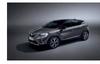
GREY CASSIOPE & BLACK BIXNK : KNG+GNE