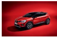
ROUGE FLAMME & BLACK BIXPA : NNP + GNE