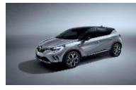
GREY HIGHLAND & BLACK BIYPE : KQA+GNE