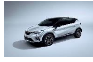
WHITE PEARL & BLACK BIXUI : QNC + GNE