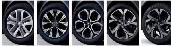
Jantă Nymphéa de 17" din oțel