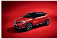
ROUGE FLAMME & BLACK BIXPA: NNP + GNE