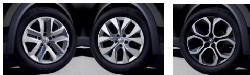
Jante otel 17", flexwheel (RTOL17/RDIF02)