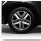
Jante flexwheel 16", design "AMICITIA" (RTOL16/RDIF10)