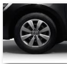
Jante din otel de 15" cu capace, design "IRENIA", (RTOL15/RDIF01)