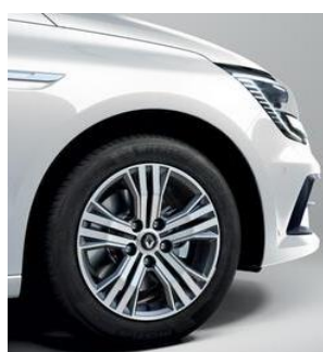
STANDARD DIESEL Jante aliaj 16", design diamantat Gris Erbe Impulse