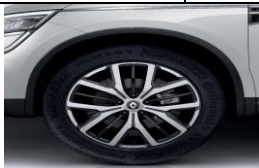
Jante de aliaj de 19" design Biton