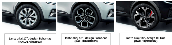
Jante aliaj 17", design Bahamas (RALU17/RDIF03)