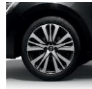
Jante aliaj 18", design RS Line (RALU18/RDIF23)

* Consola flotanta este asociata cu un schimbator de viteze futurist pentru cutiile de viteze automate