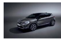
GREY CASSIOPE & BLACK BIXNK : KNG+GNE