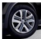
Jante otel 17", flexwheel (RTOL17/RDIF02)