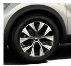
Jante aliaj 17", RALU17 RDIF12 EDRISI (sameas SL Limited)