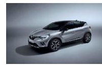
GREY HIGHLAND & BLACK BIYPE : KQA+GNE