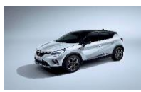
WHITE PEARL & BLACK BIXUI : QNC + GNE