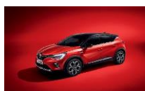
ROUGE FLAMME & BLACK BIXPA : NNP + GNE