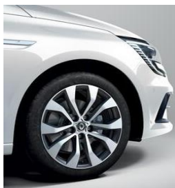
STANDARD BENZINA Jante aliaj 17" design ALLIUM