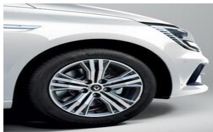
STANDARD DIESEL Jante aliaj 16", design diamantat Gris Erbe Impulse