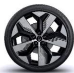
jante aliaj 20" soren