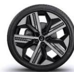
jante aliaj 20" enos

* constrangerile intre echipamentele disponibile optional pentru nivelul de echipare echilibre sunt in curs de actualizare.