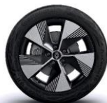
jante aliaj 18" oston