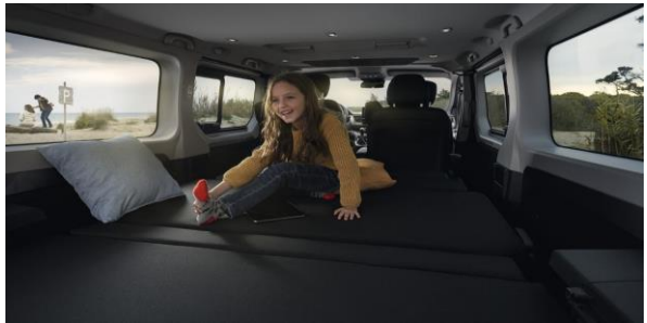
Ai avut o saptamana grea in care Spaceclass ti-a servit drept birou, sala de sedinte sau locul unde ai servit masa in tihna? Weekend-ul este aici si familia doreste sa evadeze din mediul urban? Cu pachetul Escapade transformi Spaceclass-ul din birou in rulota si evadezi din cotidian.