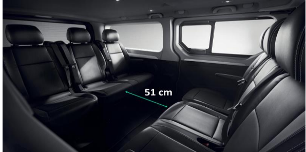
Adaptabilitate: bancheta cu 3 locuri de pe randul 2 poate fi repositionata astfel incat pasagerii sa poarte conversatii fara sa depuna prea mult efort