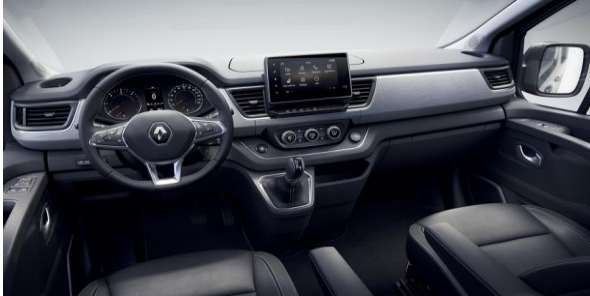
Design bord unic Spaceclass