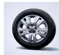
Avens 17" Aliaj RDIF03