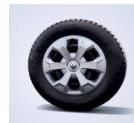
Capac ornamental 16"