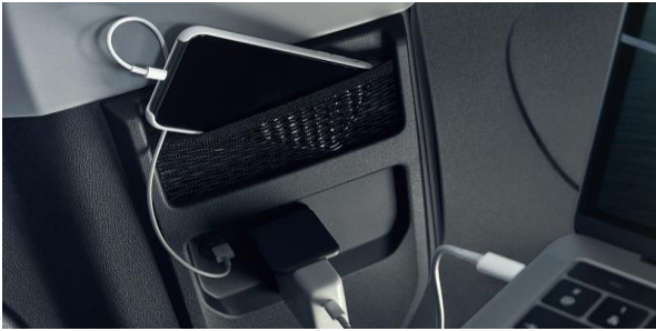
Business trip? Ai tot ce iti trebuie pentru a iti desfasura activitatea pe parcursul calatoriei: priza pentru laptop, mufa USB pentru incarcarea telefonului mobil, sala de sedinte, scaune confortabile si o capacitate de pana la 5 locuri pe randurile 2 si 3